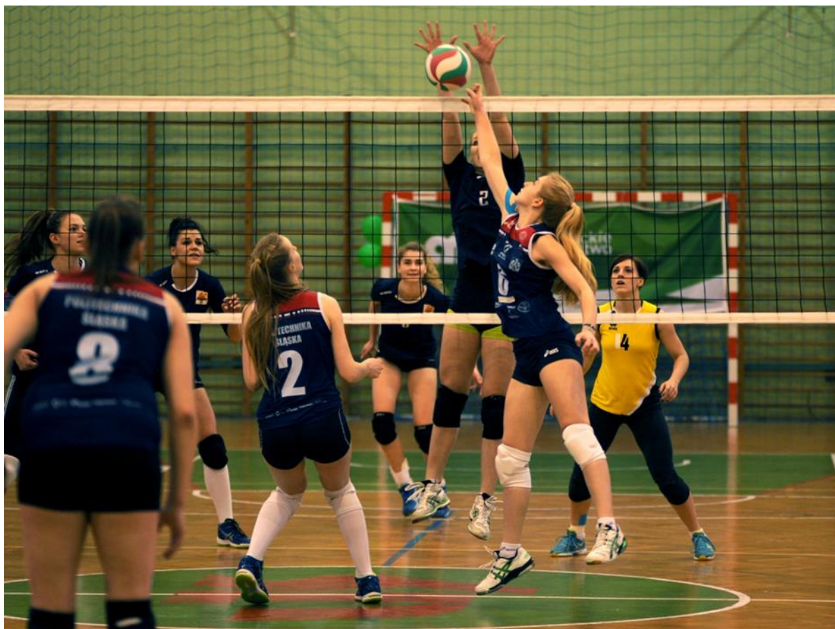
Akademickie Mistrzostwa Polski w Piłce Siatkowej Kobiet – półfinał D